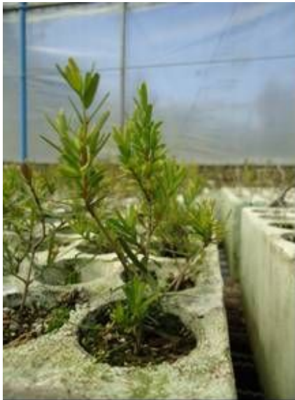
Foto 1: Estado de las estacas de Myrceugenia leptospermoides tratadas con diferentes concentraciones de hormona, (a) testigo, (b) 0,5 ppm de AIB, (c) 2.000 ppm de AIB, (d) 4.000 ppm de AIB, (e) Keriroots.