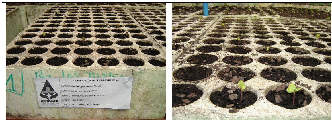
Figura 2. Proceso de germinación de semillas de Raulí (INFOR-CTPF, 2008)