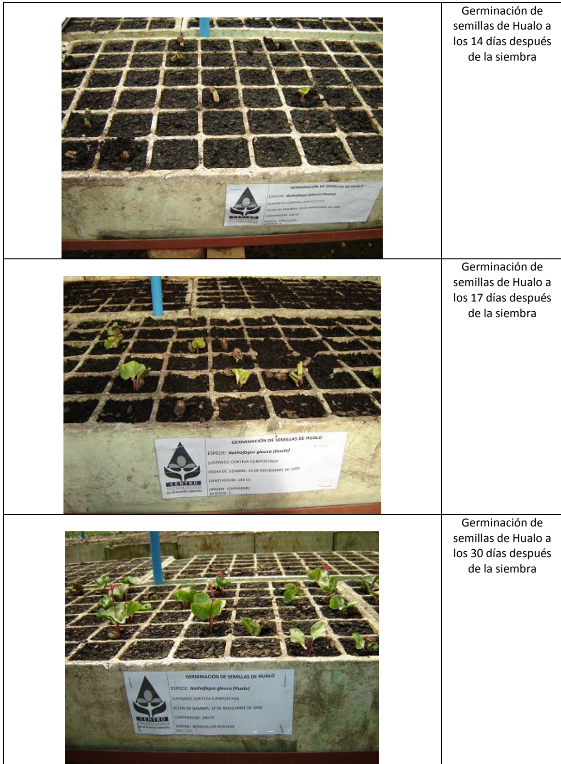
Figura 2. Germinación en invernadero de semillas de Hualo (INFOR-CTPF, 2008)